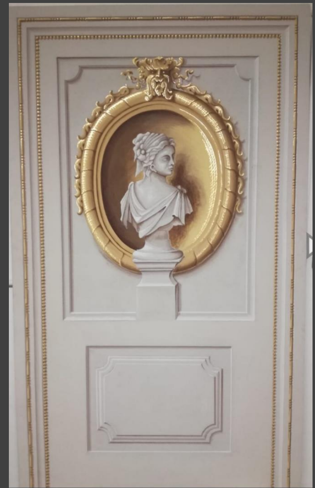
Leonardo Vannoni, pannello in multistrato intonacato, cm.200x120 circa.