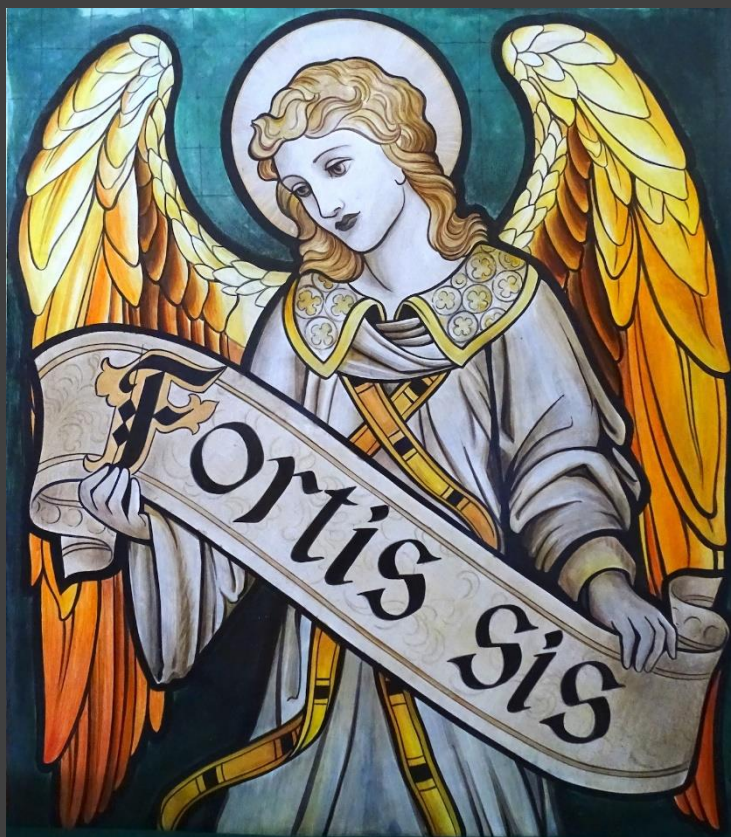
Sara Farnocchia, "In volo dal vetro all'encausto - 1" Tavola, cm. 69x60,5x1,2