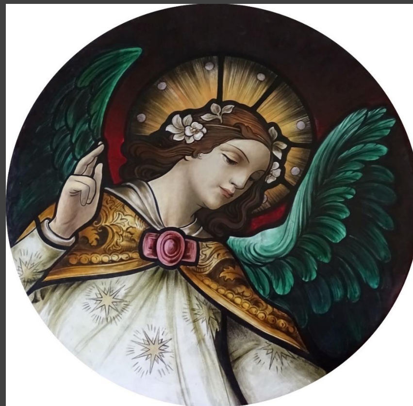
Sara Farnocchia, "In volo dal vetro all'encausto - 2" Tavola, diametro cm. 61x1,2